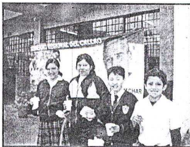
Niños del San Pedro N° 72 y Nuestro Señor Cautivo de Ayabaca, disfrutaron una nutritiva chocolatada.

Las jornadas cívicas para los escolares del primer puerto se desarrollan gracias al entusiasmo de la se-